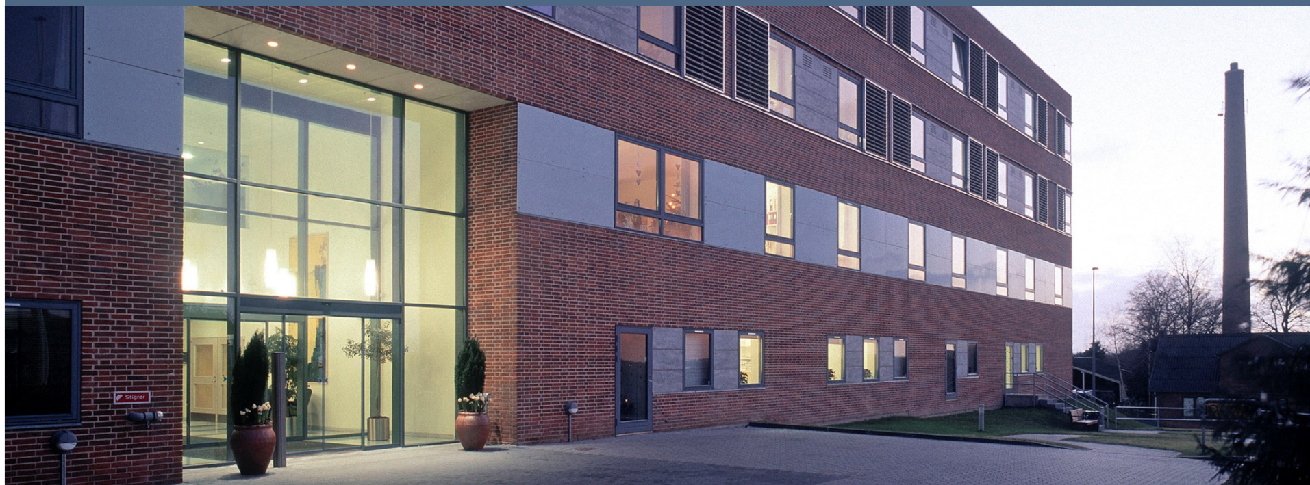
Regionshospitalet Hammel Neurocenter